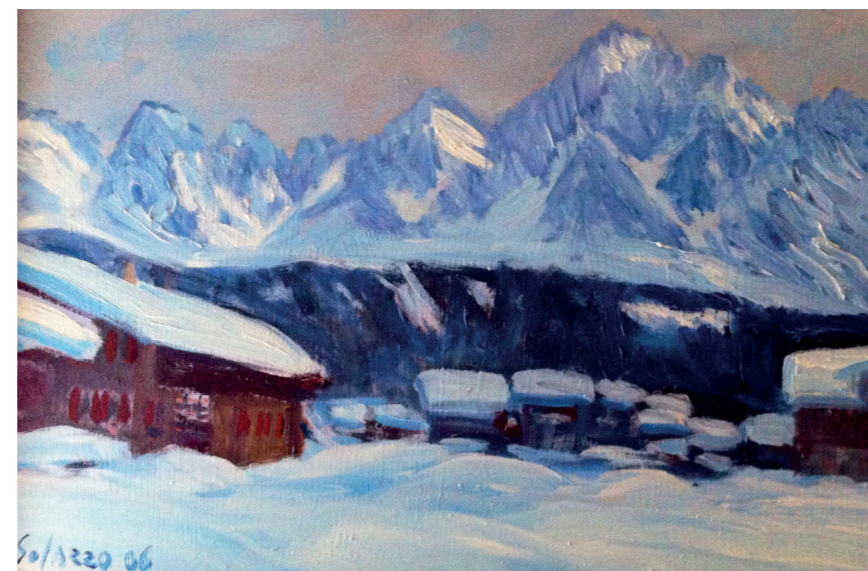
Solazzo - Dolomiti di Sappada, olio su tela cm 50x70