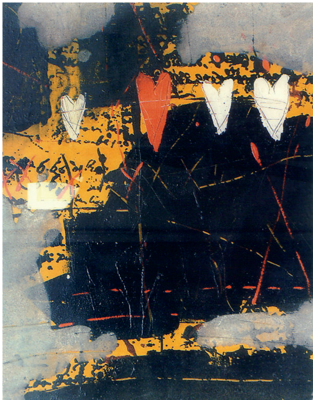
G. Celiberti, 1990-91 - Sensazione Crepuscolare, tecnica mista cm 40,2x50